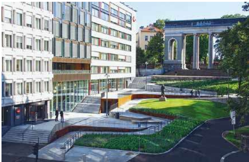
Figur 2: Schandorffs Plads i Oslo, et eksempel på "et katalog af løsninger". Pladsen tilbyder tre forskellige og integrerede måder at bevæge sig gennem pladsen på; trappe, rampe og cykelsti. Der er ingen primær løsning, men tre ligeværdige løsninger.

valget om at deltage er vores eget og ikke taget på forhånd af en ikke-inkluderende design-tilgang. Hverdagen leves ikke opdelt i faglige sektorer, men på tværs af dem og i synergien mellem dem. Vi bevæger os fra boligen, gennem byen, hen til stationen eller cyklen, frem til studiet eller arbejdspladsen, som vi skal kunne komme ind og rundt i. Vi deltager i frokosten, mødet og sommerfesten, videre til biblioteket eller fitnesscenteret og i biografen eller ud og spise med vennerne, før vi vender næsen hjem igen. Hverdagen er en flydende bevægelse gennem den by og de rum, vi planlægger, bygger og lever i. Det kræver tværfaglig viden og samarbejde at sikre, at hele kæden af hverdagslivets delelementer er inkluderende og imødekommer den høje diversitet i brugerbehov, som er virkeligheden, når alle skal være med. Universelt design tilbyder en principiel og værdibaseret ramme for at definere, kommunikere, diskutere og evaluere kvaliteten af både den enkelte og de sammenhængende løsninger.