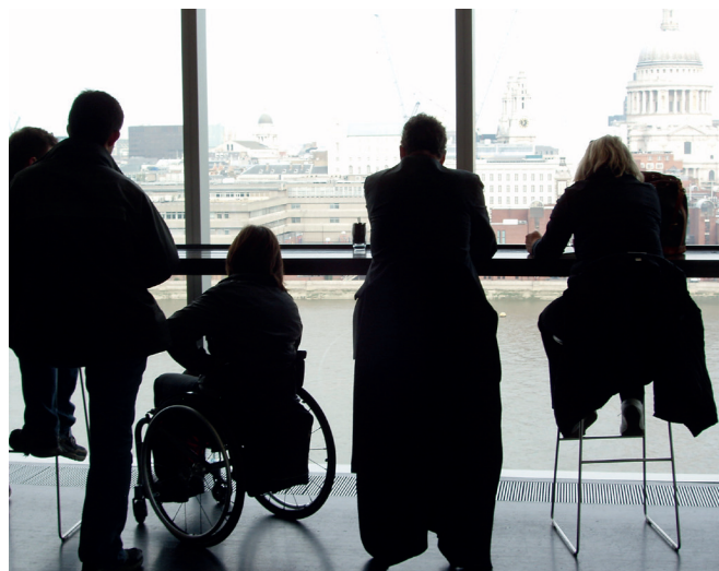
Cafeen ved Tate Modern

Ved netop at tage afsæt i den komplekse bredde af brugerbehov, den stimulerende løsningstilgang og den helhedsorienterede forståelse af kvalitet i oplevelse og brug, kan universal design tilbyde en anden metode end den udbredte tilgængeligheds-tjekliste tilgang, som ofte først kommer i spil sent i en proces.